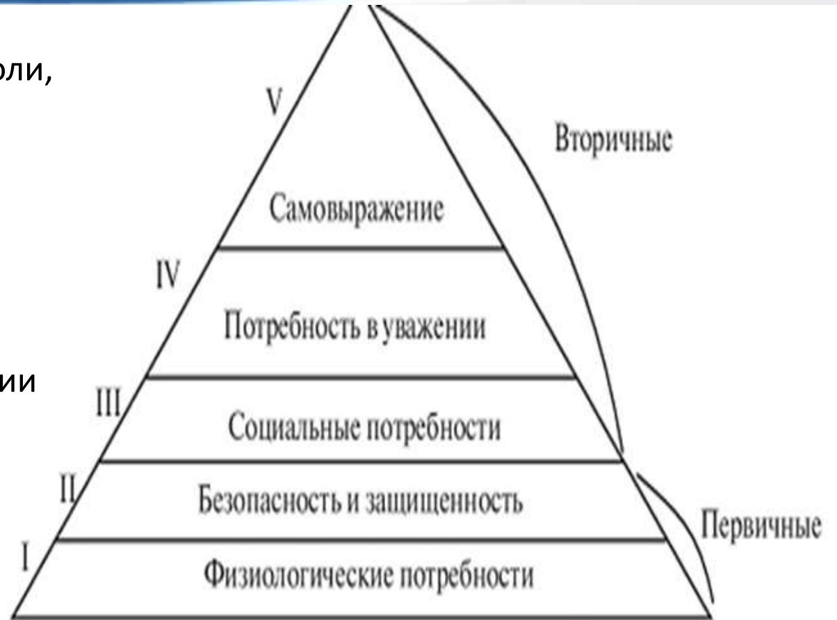
Рис. 2.2. Пирамида потребностей А. Маслоу